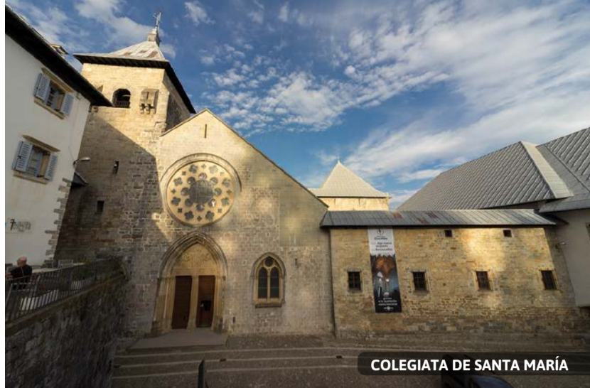
COLEGIATA DE SANTA MARÍA