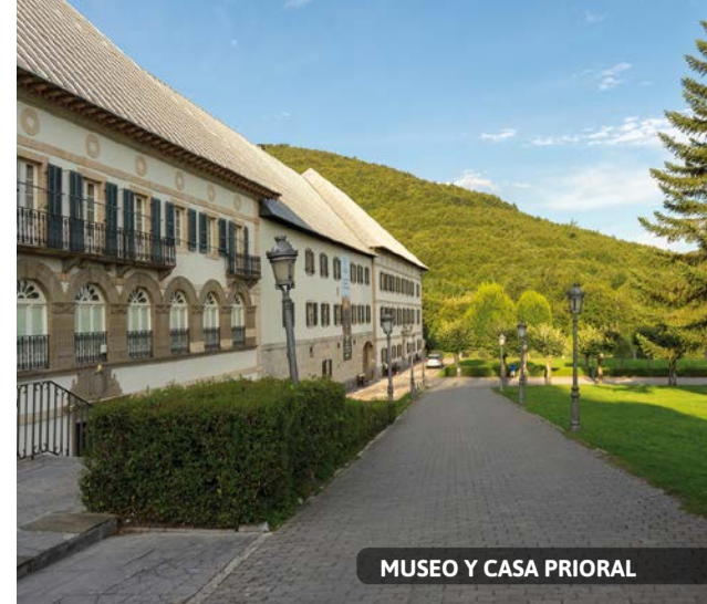
MUSEO Y CASA PRIORAL