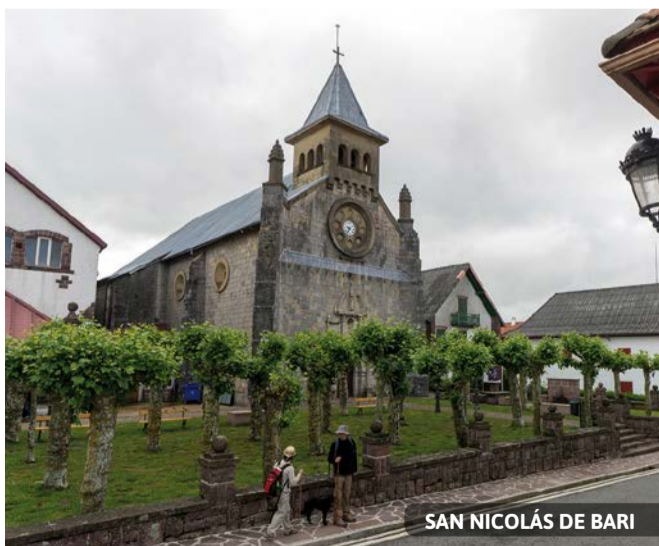
SAN NICOLÁS DE BARI