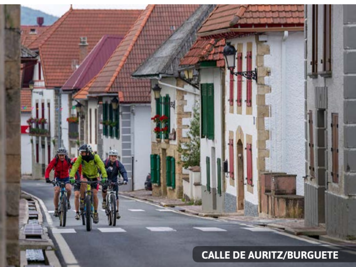
CALLE DE AURITZ/BURGUETE

El hospital nuevo fue levantado entre 1802 y 1807 en el austero estilo de la época. Es el actual albergue de peregrinos. Con anterioridad, hubo otros edificios de atención a peregrinos de los que ha quedado testimonio en diversos documentos y en los restos encontrados frente a la iglesia de San-